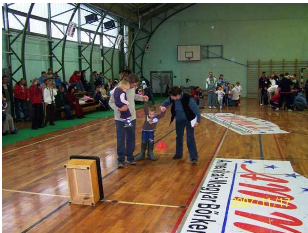
2007. Gumicsizmában futás a sorversenyen