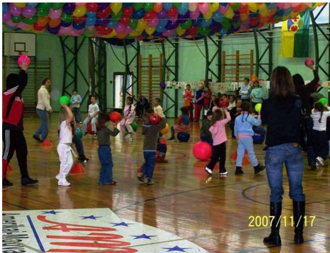
2007. Óvodások műsora