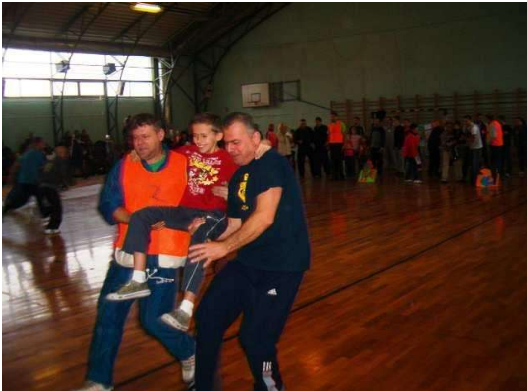
2011. Az én gyerekem, a te gyereked, mindegy: FUTÁS!