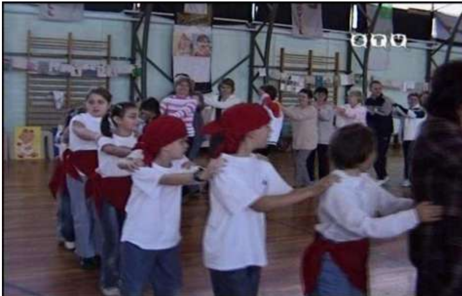
2005. Mindenki vonatozik