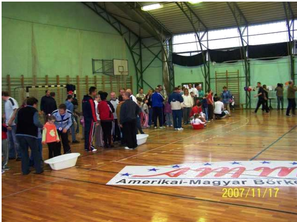
2007. Kis pihenő, felkészülés a következő versenyszámra