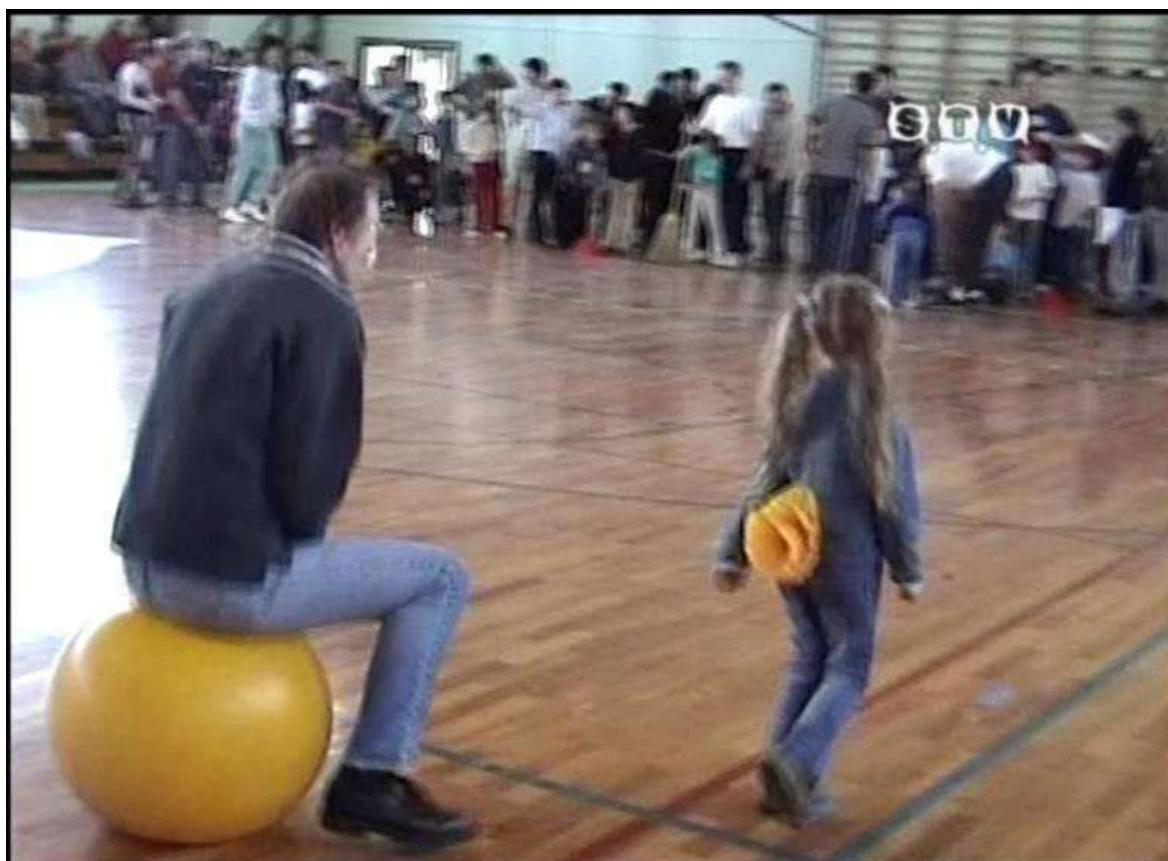
2005. Apa a labdán