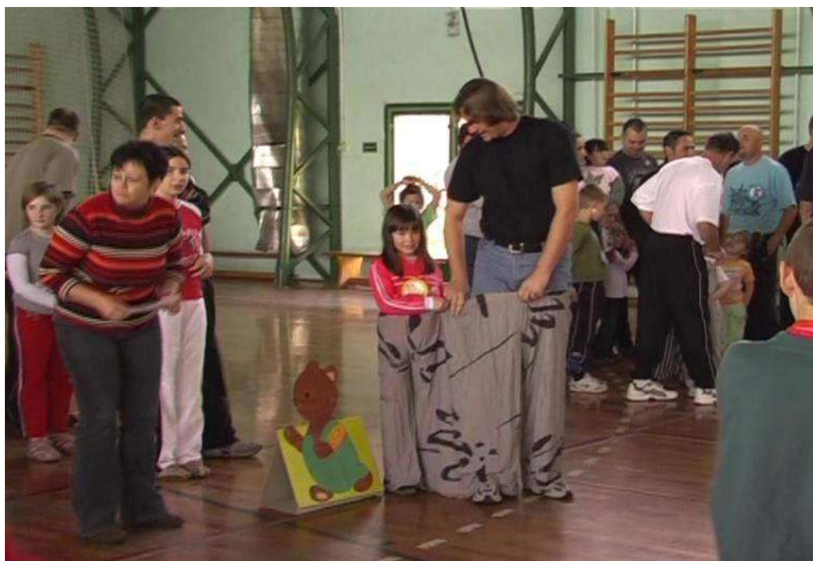
2008. Háromszárú nadrág