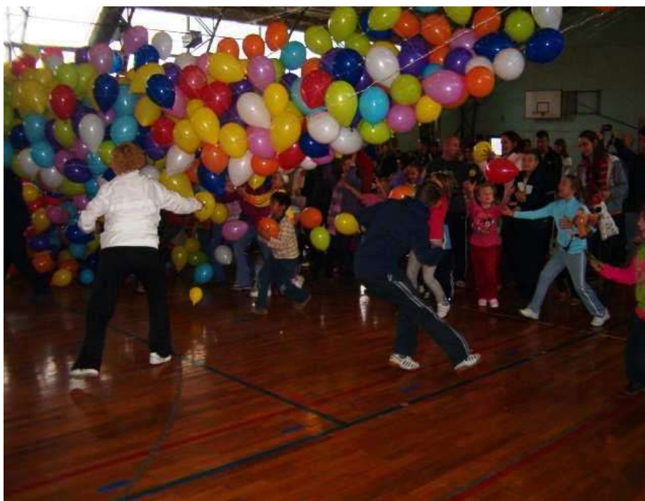
2011. Lufieső indul, a segítők készenlétben, hogy a háló ne hulljon a gyerekekre