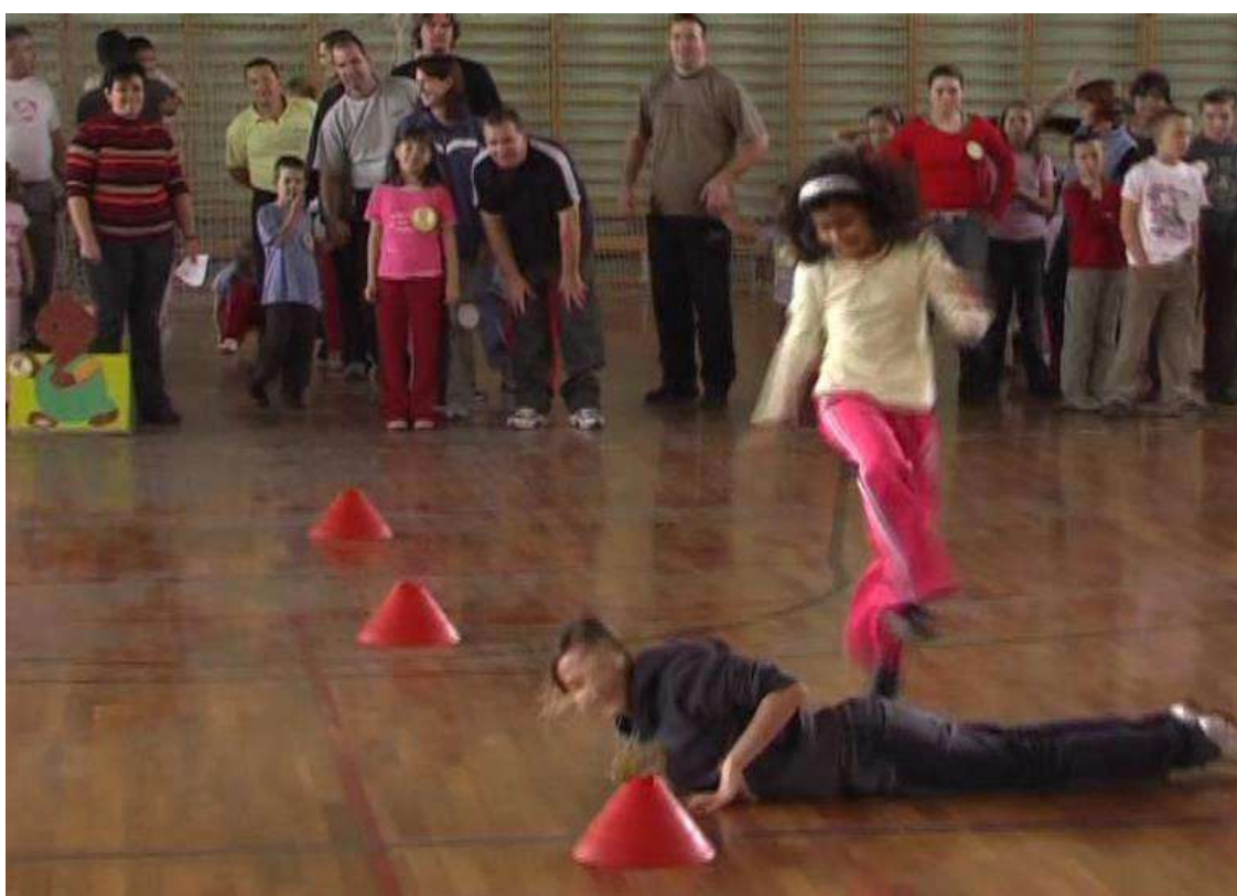
2008. Ugord át apát (A képen éppen a beugró anyát)