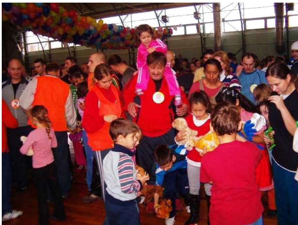
2011. A nyemény elosztása sem egyszerű feladat: főszerepben az újrahasznosított plüsskedvencek