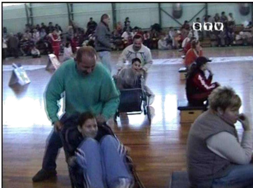
2005. Babakocsi- rodeó