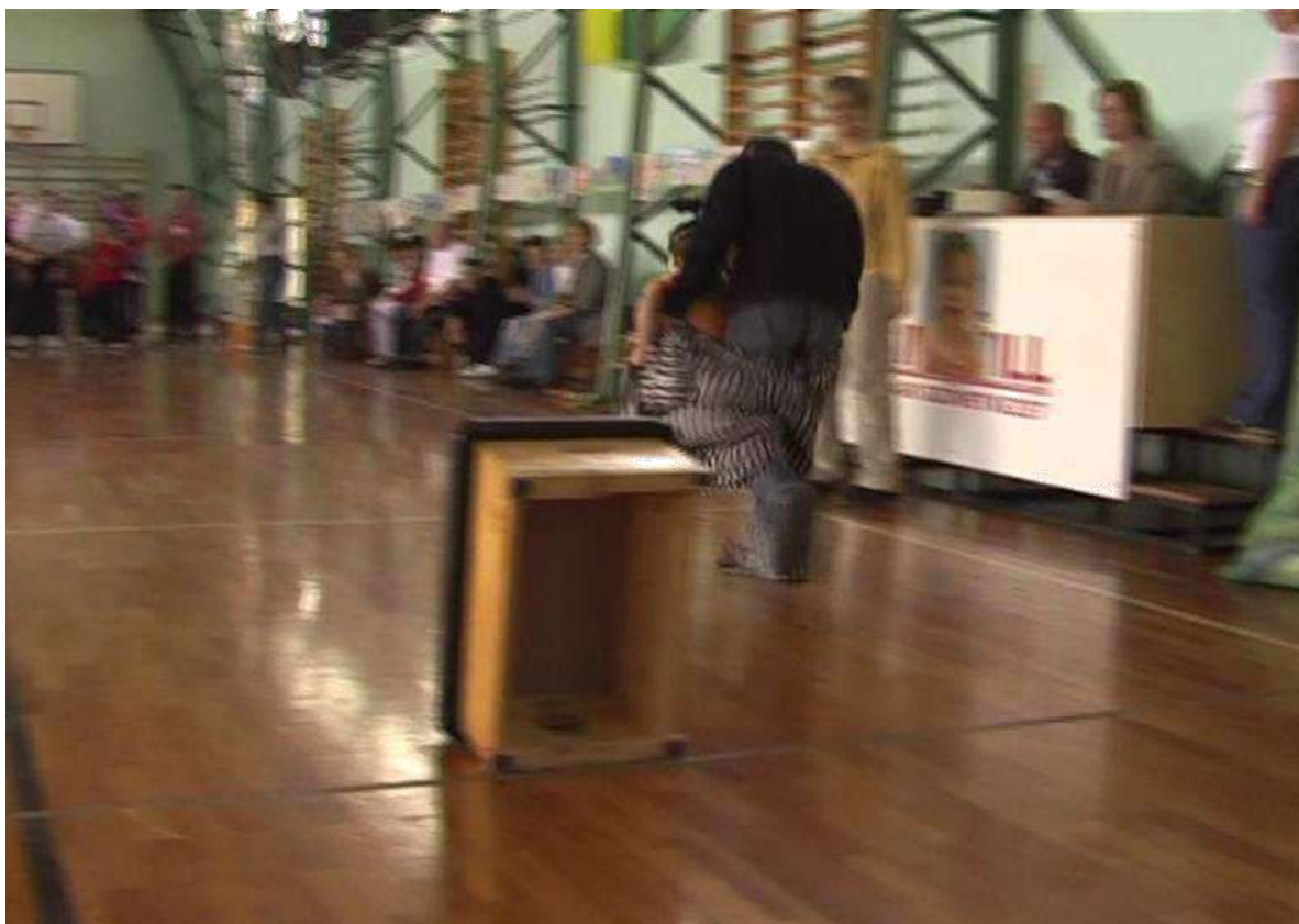
2008. ...mindenki másképp csinálja