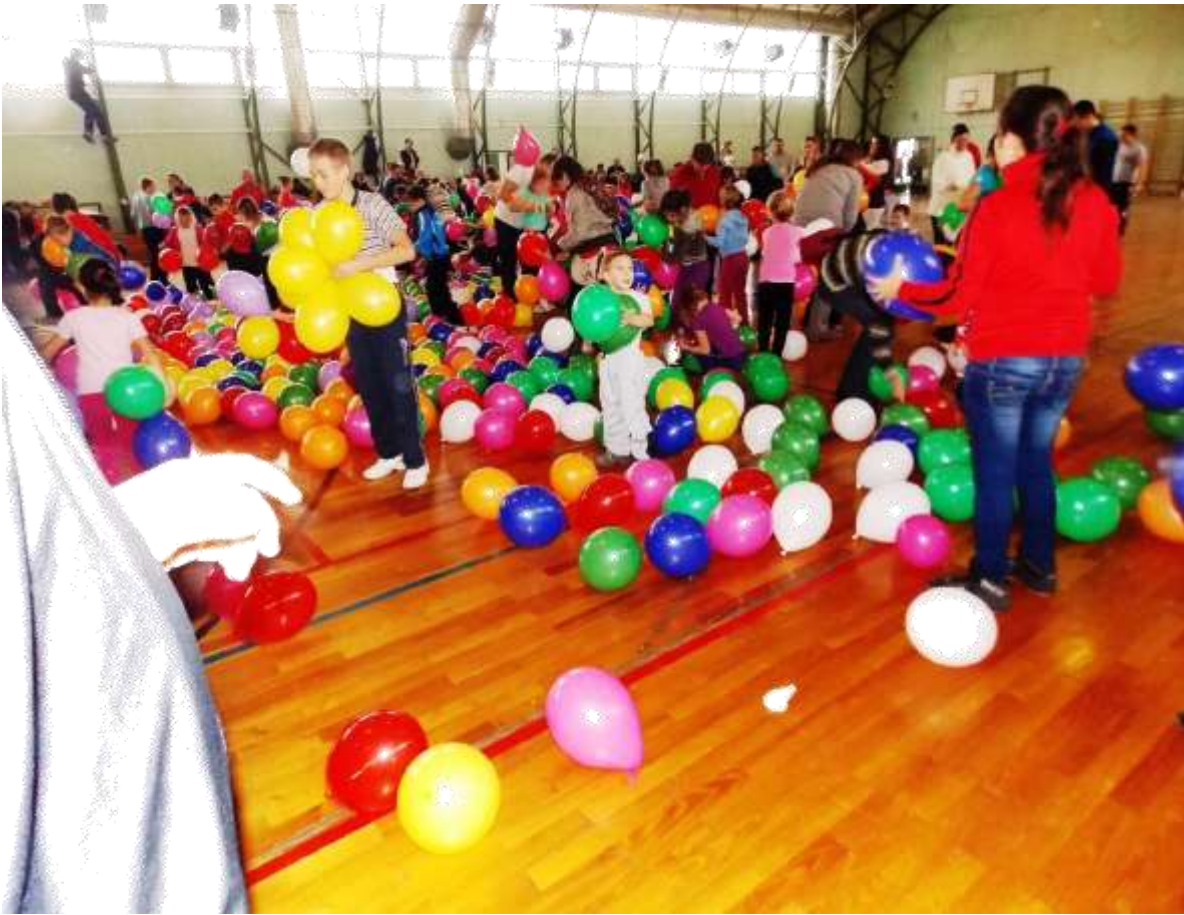
2012. Lufigyűjtés: kicsik és nagyok