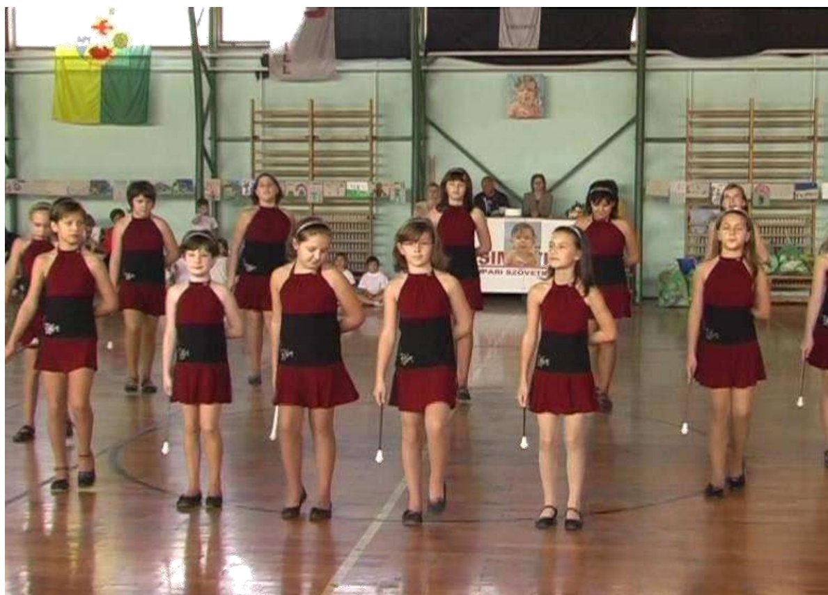
2008. Mazsorett tánccsoport műsora