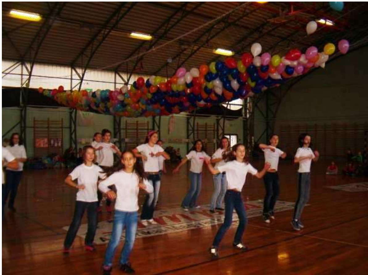
2011. Iskolások műsora